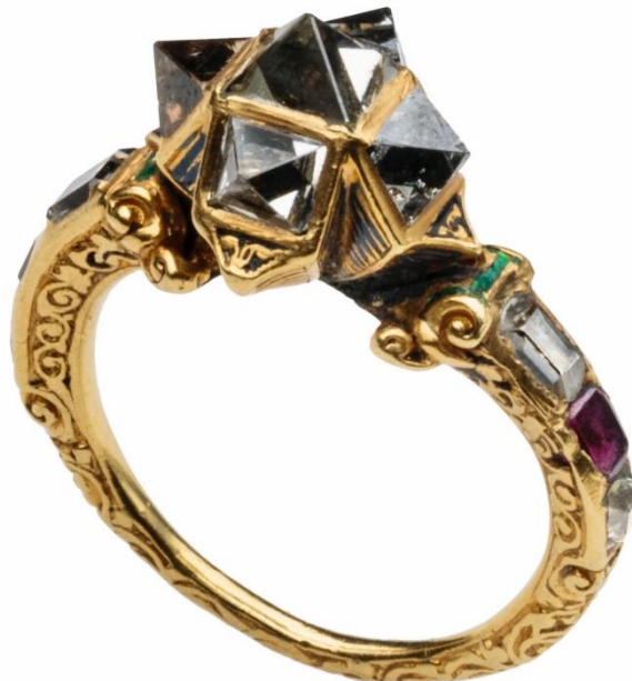
The Point Cut The Spizer Renaissance Diamond, Ruby, Enamel Ring Italy Venice (?) 16th Century

La collection commence par le diamant octaédrique. Par des exemples exceptionnels, d'importance internationale, ces diamants montrent comment les bijoutiers ont progressivement capturé l'attrait de ces gemmes indomptables, évoluant de la taille en pointe en taille brillante.