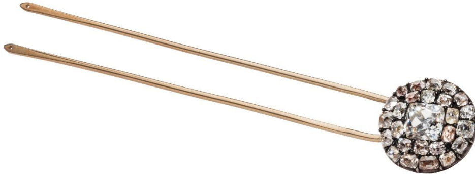
The Brilliant Cut The St. Alban's Bodkin England, 17th Century, Remounted and Inscribed 18th Century

Le succès de la taille brillant (proche de nos tailles actuelles) a éclipsé les formes antérieures, dont beaucoup ont été retaillées pour les « moderniser », avec pour résultat que les coupes antérieures de diamants « old mine », inclus ici, sont extrêmement rares.