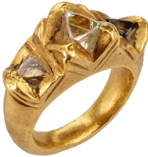
The Octahedral Diamond Sultan Muhammad of Ghor's Diamond Ring Afghanistan or Pakistan, 13th Century

découverte de mines au Brésil, une source qui a changé l'Inde et inauguré un nouvel âge du diamants.