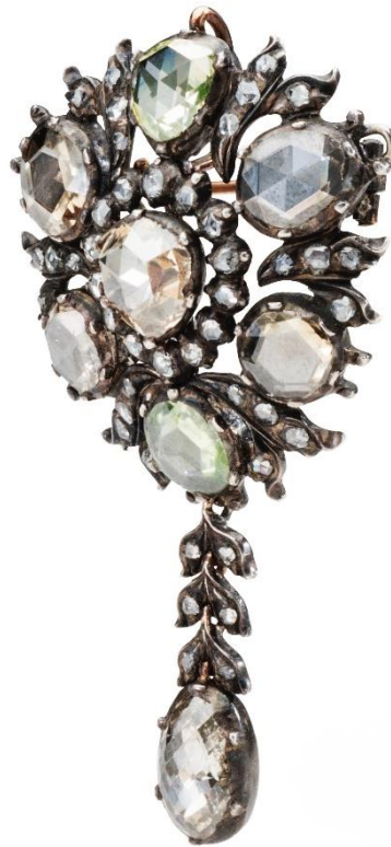
The Rose Cut The Dutch Rose Jewel Western Europe, The Netherlands(?) Early 18th Century