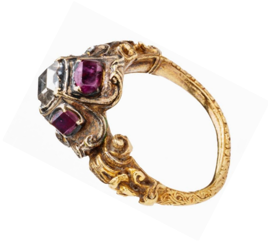
The Table Cut The Guilhou Renaissance Table Cut Diamond and Ruby Ring Western Europe, 16th Century